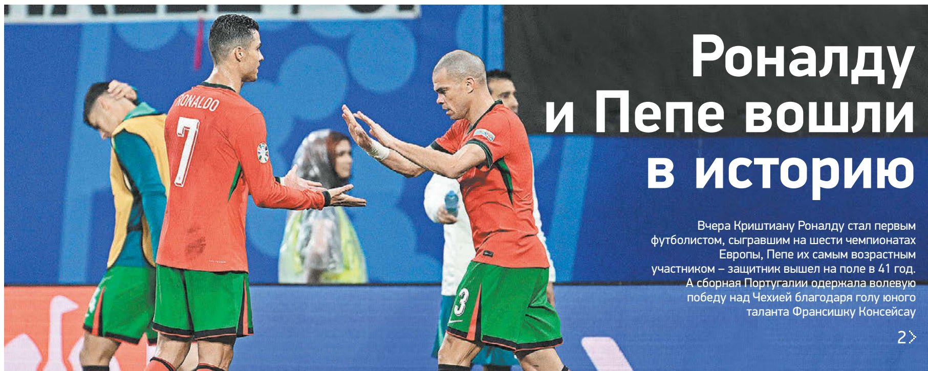
Вчера. Лейпциг. Португалия – Чехия – 2:1. Криштиану Роналду и Пепе