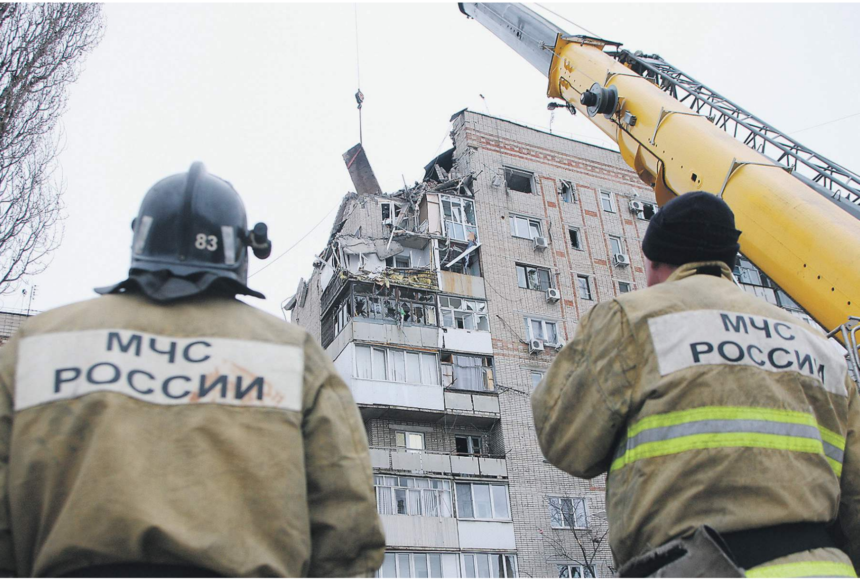
На момент подписания номера судьба четырех жильцов оставалась неизвестной

О предполагаемых причинах взрывов в жилых домах и возможных мерах по их предотвращению президенту доложит глава МЧС Евгений Зиничев, сообщил «Известиям» источник в ведомстве. Собеседник в правительстве России уточнил, что на встрече ожидается и выступление главы Челябинской области Бориса Дуровского. Вызван на совещание и ростовский губернатор Василий Голубев, рассказали в правительстве региона. Также в числе участников мероприятия в кабмине называют председателя правительства Дмитрия Медведева и вице-преьера Виталия Мутко, ответственного за работу жилищно-коммунального хозяйства.