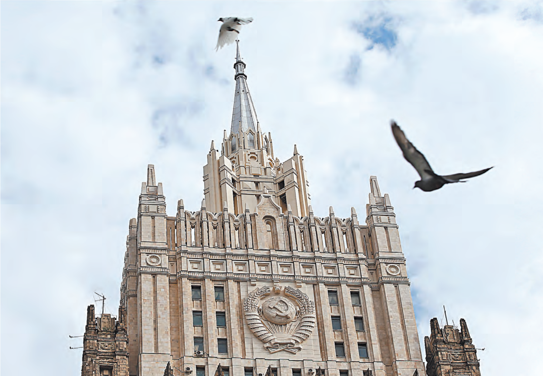
Министерство иностранных дел России подчеркивает готовность к диалогу с США, но ни одну санкционную «волну» из Вашингтона «безнаказанной не оставит».

Начнем с первого. С конца сороковых годов прошлого века Москва и Вашингтон были друг для друга, без сомнения, главными собеседниками. Беседа носила конфронтационный характер, но составляла стержень мировой политики. Ее центральность определялась военно-политическими возможностями сторон и паритетом этих возможностей. За годы «холодной войны» была выработана система стабилизации и рационализации противостояния, работавшая достаточно эффективно. С начала девяностых годов паритет исчез по большинству параметров, за исключени-