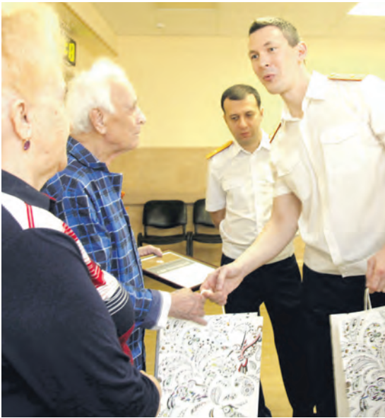
Следователи Прикубанского и Западного отделов СУ СКР по краю пришли с подарками к пациентам краснодарских госпиталей.