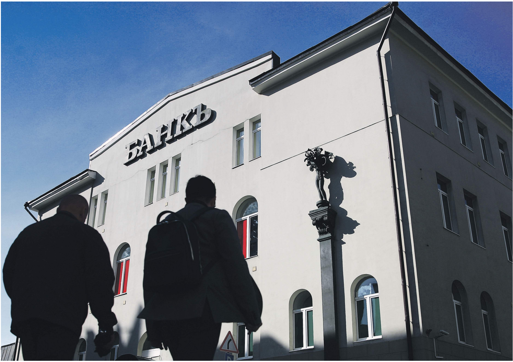
Павел Бородин / «Известия»