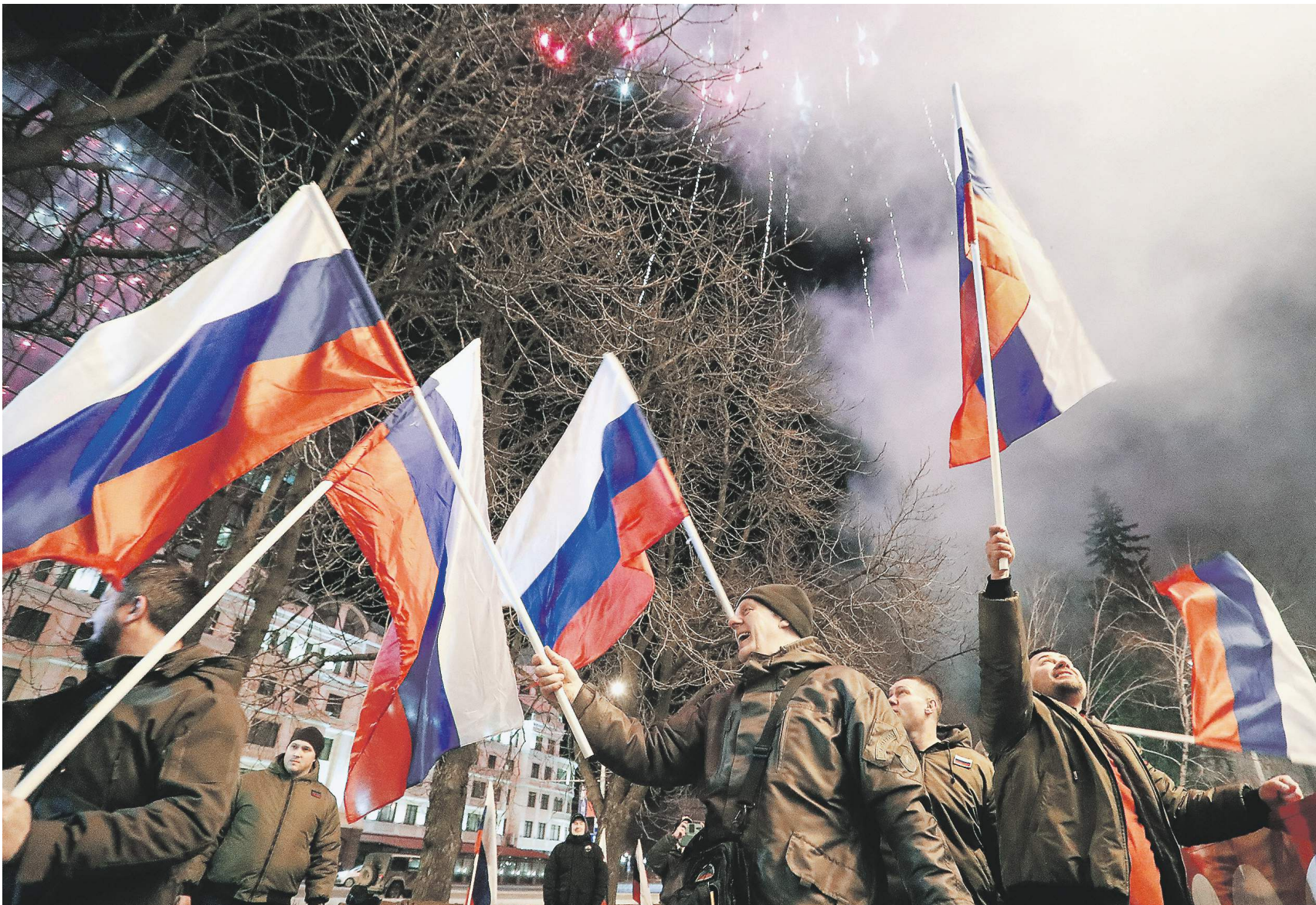
После подписания документов о признании Россией ЛНР и ДНР жители республик не скрывали своей радости (21 февраля, Донецк)

21 февраля главы ДНР и ЛНР Денис Пушилин и Леонид Пасечник обратились к Владимиру Путину с просьбой признать независимость республик. В этот же день президент обсудил вопрос на внеочередном заседании Совбеза.