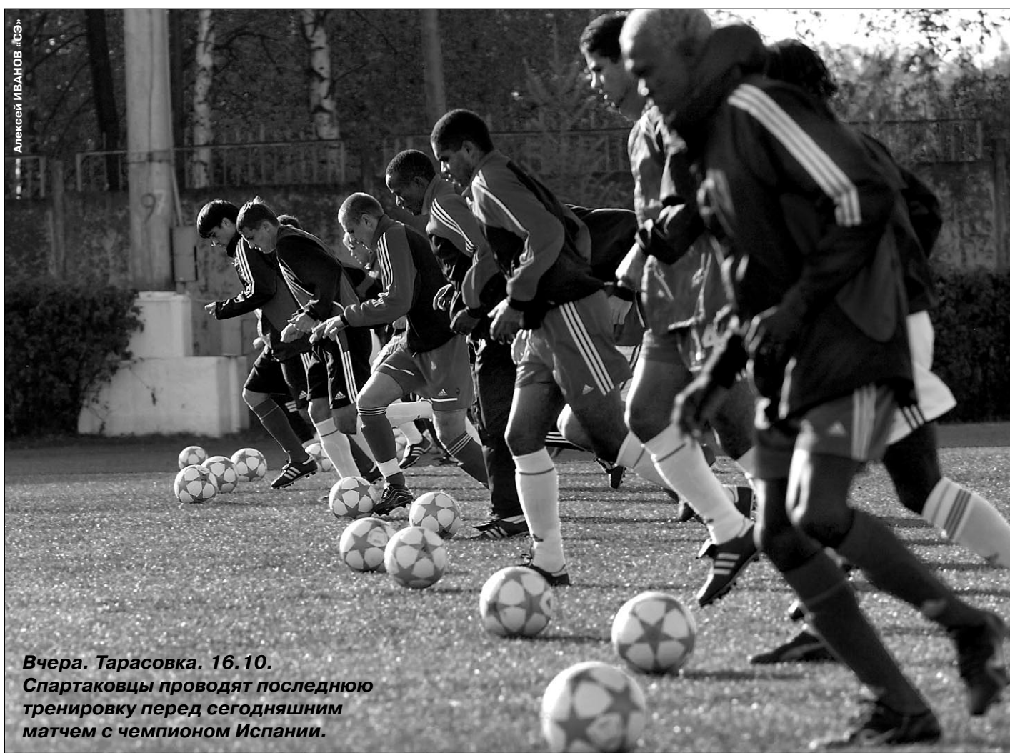
Вчера. Тарасовка. 16.10. Спартаковцы проводят последнюю тренировку перед сегодняшним матчем с чемпионом Испании.

Фоторепортаж о прогулке испанцев по Красной площади, пресс-конференции главных тренеров команд Рафаэля Бенитеса и Олега Романцева, а также другие материалы о предстоящем матче - стр. 2 - 3