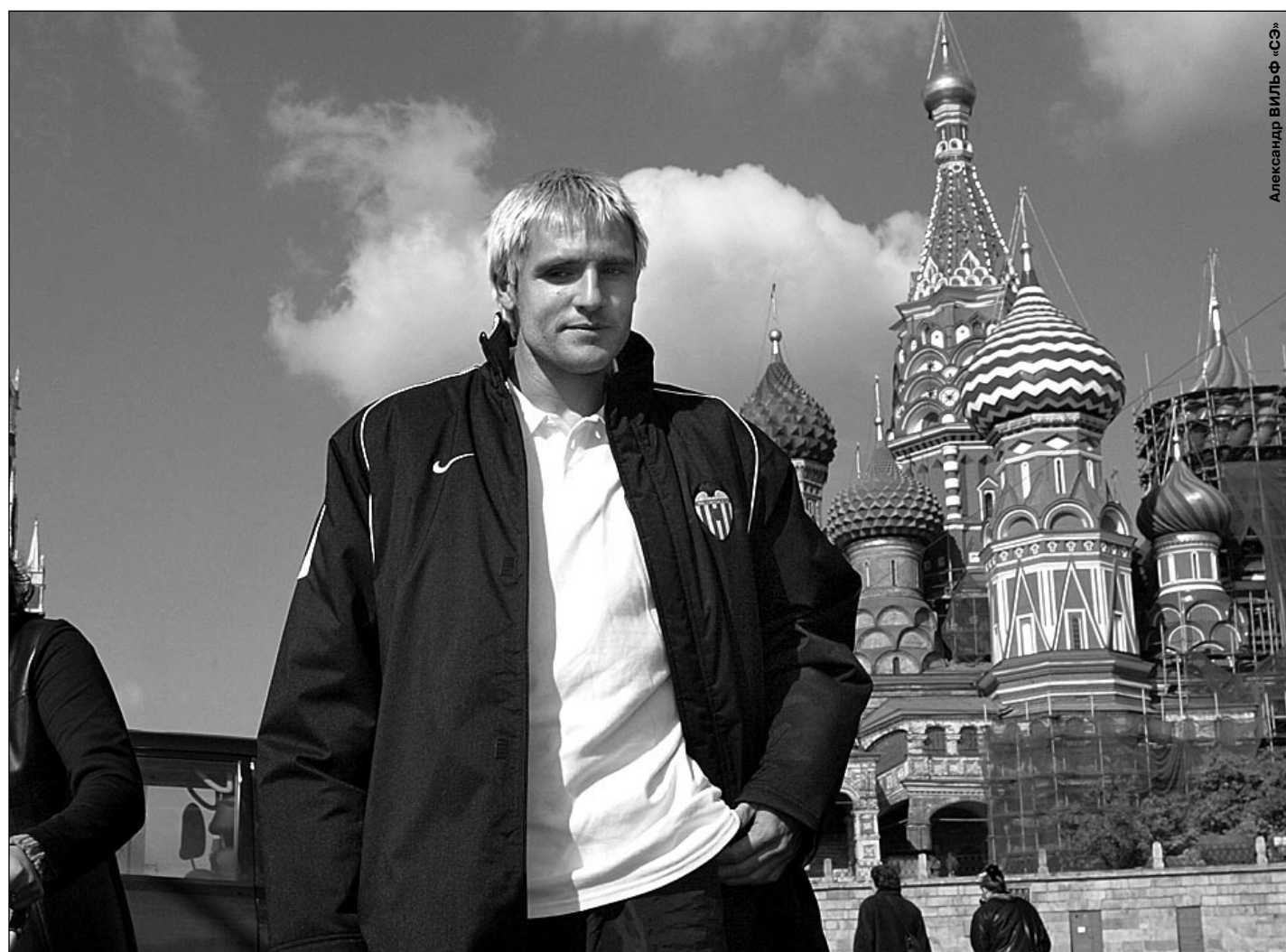
Вчера. Москва. Красная площадь. 12.50. Вратарь Сантьяго КАНИСАРЕС и другие футболисты «Валенсии» - у стен Кремля.

Весь вчерашний день спартаковцы провели на базе в подмосковной Тарасовке, сосредоточившись на подготовке к матчу с «Валенсией». А вот испанцы до тренировки успели познакомиться с достопримечательностями российской столицы.