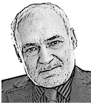
Андраник Мигранян политолог

Вслед за этим разразился еще один скандал, показывающий, что не только Госдеп, но и другие большие государственные институты живут своей собственной жизнью и могут быть использованы как самими руководителями этих институтов, так и политическими властями, для решения своих политических задач, далеких от нужд и интересов общества в целом. Руководство IRS (американская налоговая служба) было обвинено в том, что в некоторых подразделениях этой организации представители налоговой службы отказывали организациям «партии чаепития» в регистрации их как освобожденных от налогообложения общественных структур. Скандал