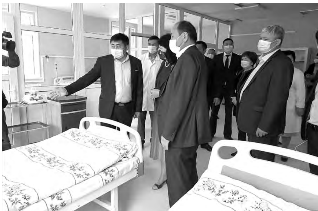
ПРЕСС-СЛУЖБА ПРАВИТЕЛЬСТВА КР