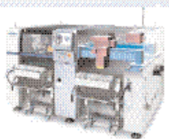
Установщик компонентов поверхностного монтажа FX-3