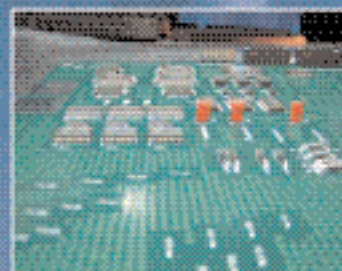
Оценка эффективности и стоимости новых видов влагозащитных покрытий