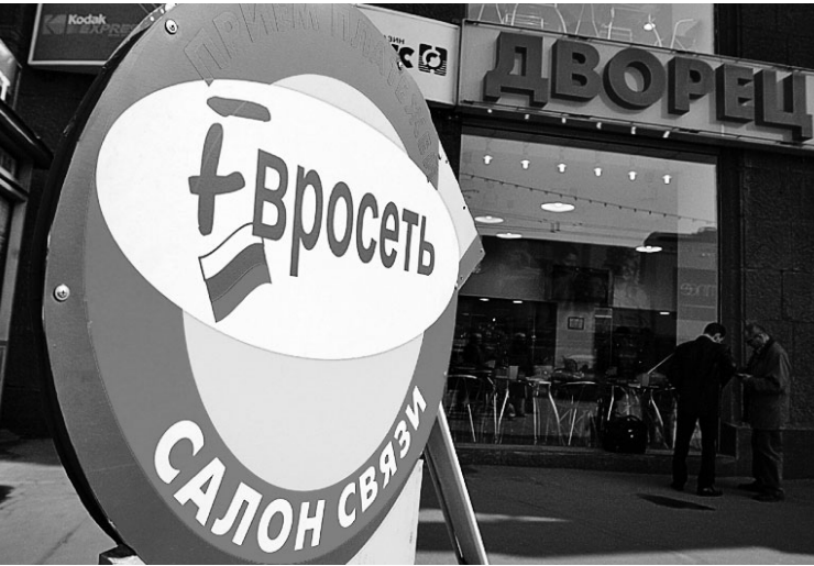
Вопросами к «Евросети» МВД не ограничится

жания партий «серых» мобильных были и раньше, но такой крупной — впервые, потому оно и наделало шуму». «Пока даже не составлена полная опись изъятых телефонов, — заявили «Известиям» в пресс-службе следственного комитета при МВД. — Эти телефоны — вещественные доказательства. Следовательно может даже вернуть их владельцу на ответственное хранение, а может передать на специальные склады. Если изъятый товар имеет ограниченный срок хранения, он должен быть реализован до того как станет негодным. Если подозреваемый будет признан судом виновным, то ему вернут деньги.