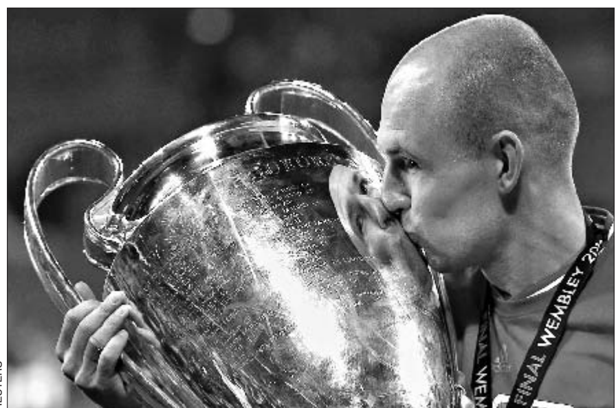
Суббота. Лондон. «Боруссия» Д - «Бавария» - 1:2. Автор победного гола Арьен РОББЕН с Кубком чемпионов.

сок), верх в конечном итоге одержали не стратегия и разум, а эмоция. Да, победный мяч «Баварии» вытек из хода игры. Даже в первом тайме, который команда, по словам Юппа Хайнкеса, провалила, будущий чемпион мог забить сопернику трижды и по количеству передач превосходил его вдвое (попаданий - 130 против 260), а во втором погугу подопечных Юргена Клоппа стали неметь. Но если бы забил не Роббен, финал лишился бы главного - морали. Которая, как известно, всегда звучит в самом конце. Этот матч доказал, что если ты упрешься рогом, продолжишь настойчиво работать и мечтать, то после одной, двух, десяти неудач все равно однажды станешь первым. Что лучшим из лучших можно оказаться и в 68 лет, утерев сопливый нос каталонскому выскочке и нагадив в его светлое баварское будущее: «Попробуй повторить!» Что команда лузеров, чьи вторые и третьи места в больших турнирах уже не подвергались сомнению, в итоге заставит противников пасть на колени перед ее несокрушимой мощью. Братья Стругацкие ошибались. Богом быть легко. Трудно было перед тем, как ты им стал.