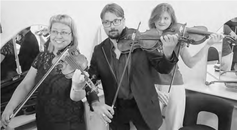
Музыканты Омского симфонического оркестра получили новые скрипки и альты.