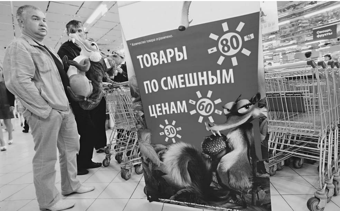
Экономическая ситуация не способствует безоглядному потреблению. Несмотря на все усилия ритейлеров, розничные сети готовятся к снижению уровня доходов