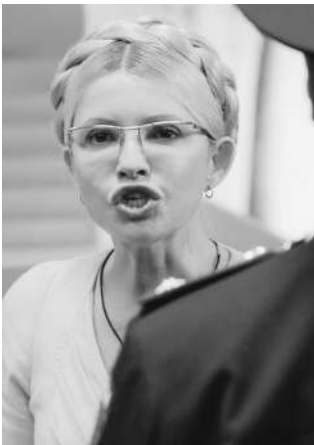
Юлия Тимошенко сдаваться не собирается

DJIA 11433,18 ▲ NASDAQ 2566,05 ▲ MMBE 1361,84 ▼ PTS 1350,04 ▼ НЕФТЬ BRENT 106,083 ▼ ЗОЛОТО 1664,63 ▼ РУБЛЬ/€ 42,9032 ▼ РУБЛЬ/$ 31,4903 ▼