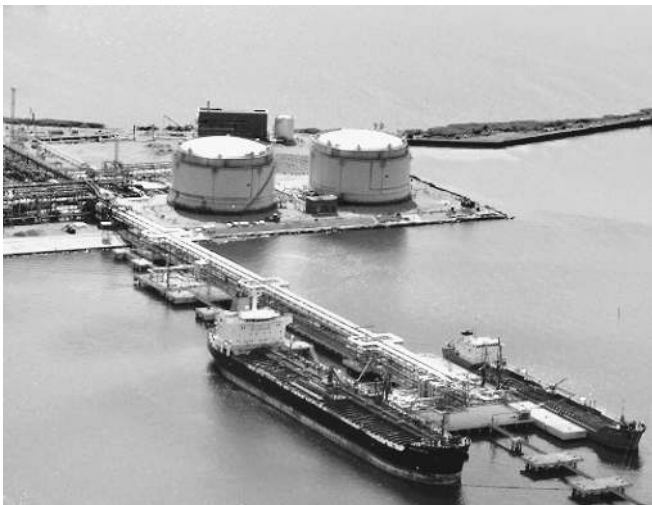
«Петербургский нефтяной терминал» делает ставку на рост экспорта и потребления дизельного топлива

Главный довод «за» — выполняемая реконструкция российских НПЗ неминуемо приведет