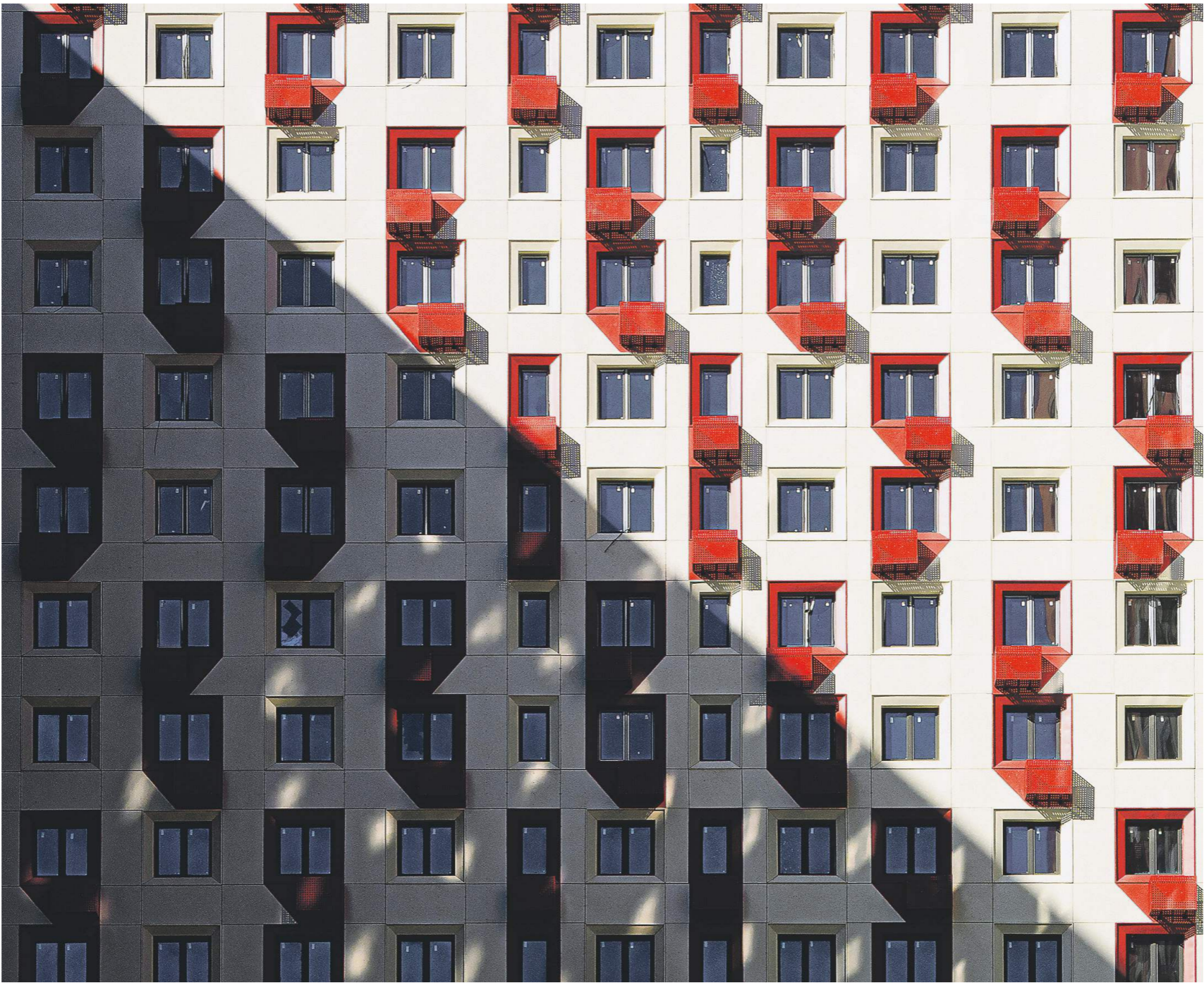
Константин Кошкин / Известия