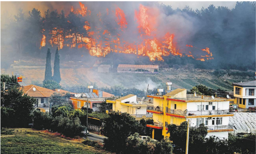
Masaba Ciftci Anadolu Agency / Getty Images