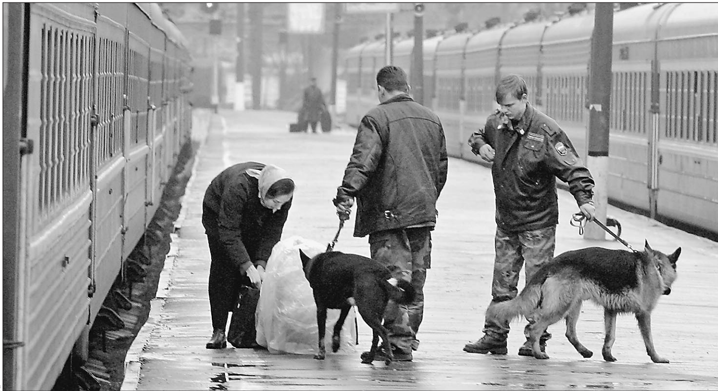
Столичная милиция подозревает в подготовке терактов практически каждого

Информация о возможности беспрецедентного теракта в столице подтверждается