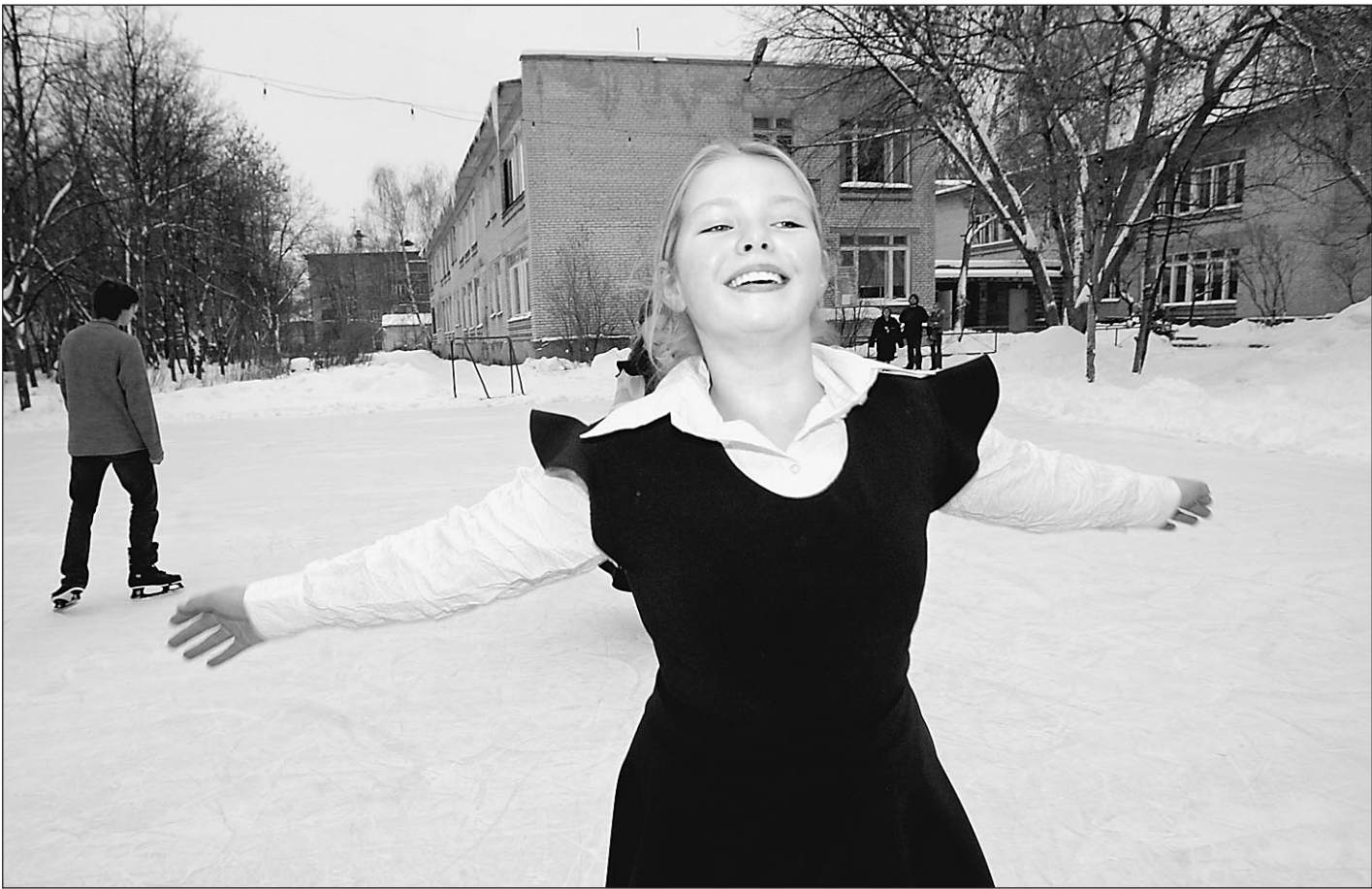
Январь. Малаховка. Школьный праздник