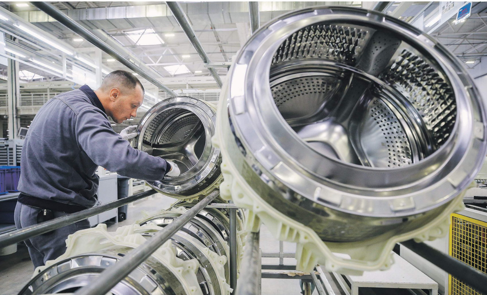
20 тысяч новых рабочих мест появилось в ТОР с 2016 года (на фото — линия производства барабанов на заводе стиральных машин Haier, Набережные Челны)

За неполный год в территориях опережающего развития количество резидентов увеличилось — с 281 до 500, сообщили в Минэкономразвития. Активный рост числа инвесторов в ведомстве объяснили повышением интереса предпринимателей к специальным территориям и пониманием плюсов работы в них. Тенденция связана и с тем, что большинство ТОР было создано в период 2017–2019 годов и потенциальные инвесторы приступили к реализации своих проектов после получения статуса резидента, что произошло