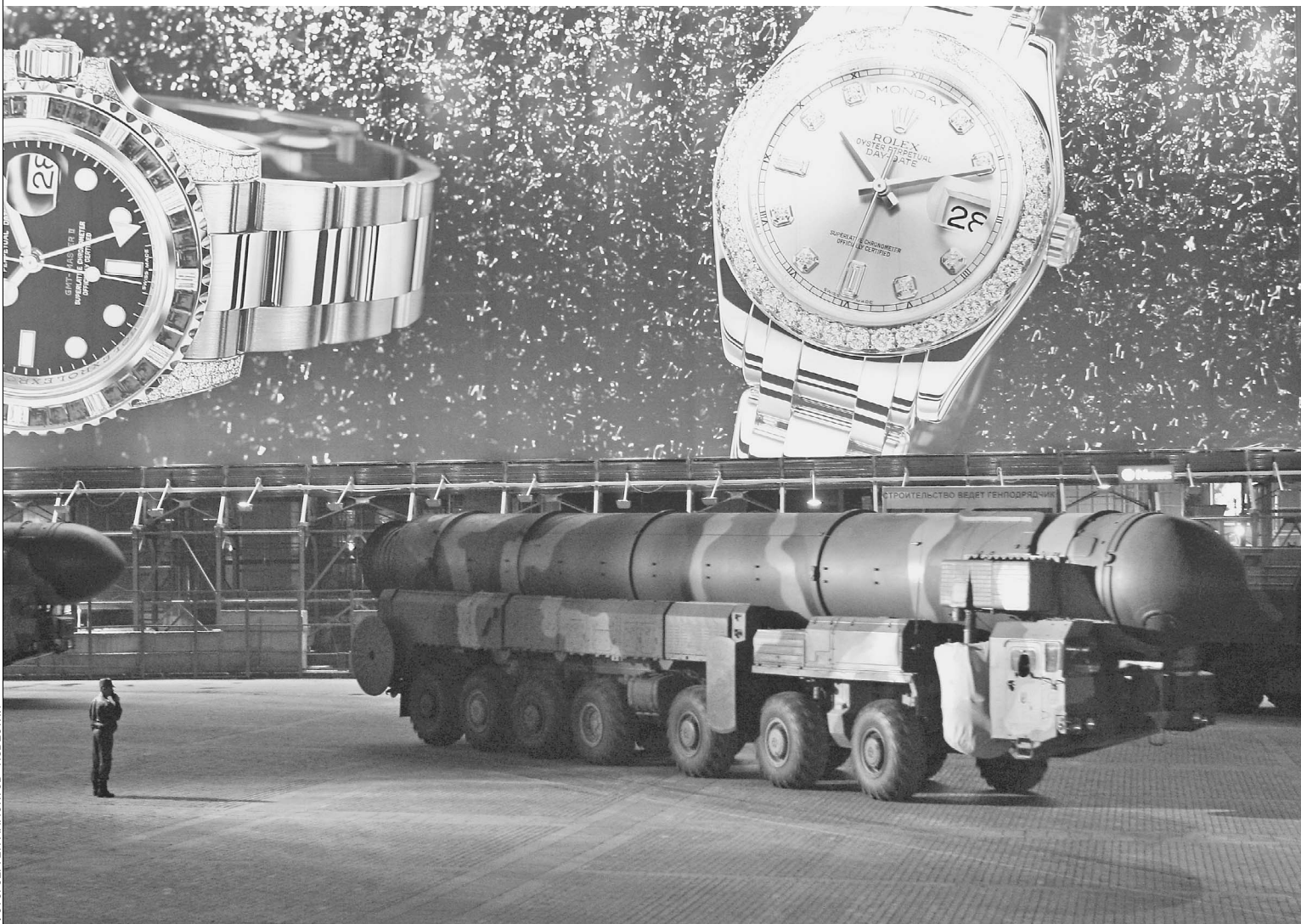
Ракетный комплекс «Тополь» — надежное средство профилактики любого ядерного конфликта

Командование РВСН заверяет: нанести удар по России «безвозмездно» невозможно