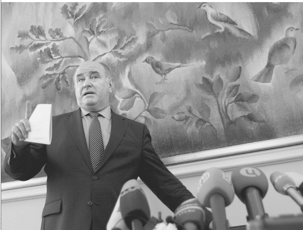
Григорий Карасин на пресс-конференции в постпредстве России в Женеве

В середине ноября в Женеве состоялась вторая встреча по вопросам безопасности и стабильности в Закавказье. Важно сразу отметить: в тихом швейцарском городе идут не переговоры и не консультации, а именно дискуссии, позволяющие общаться абсолютно неформально и свободно. У общественности, политиков и журналистов возникает много вопросов об их содержании, целях, имеющихся проблемах и успехах. Постараемся разобраться в хитросплетениях этого процесса. → стр. 5