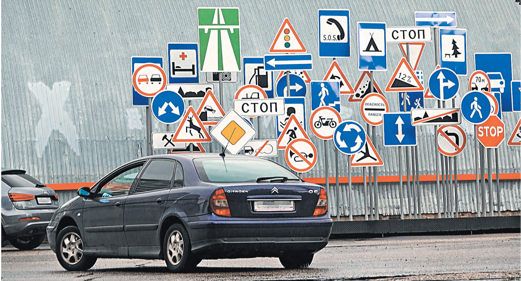
Для аккуратных нерискованных водителей ЦБ предлагает сделать максимальную скидку на ОСАГО.

ки не смогут учитывать для изменения тарифа? Можете их назвать?