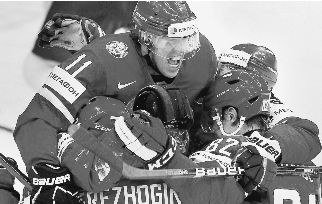
Сборная России стала чемпионом мира по хоккею, обыграв словаков со счетом 6:2