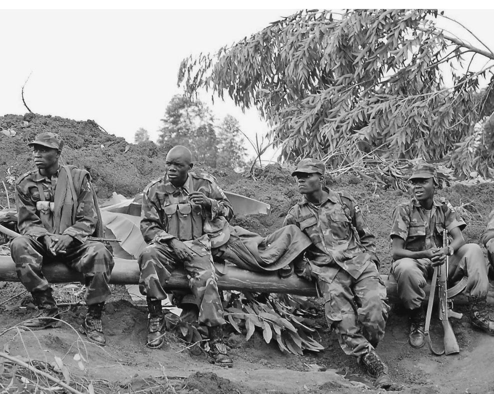
Бойцы угандийской армии ждут, когда в их распоряжении окажется современное оружие