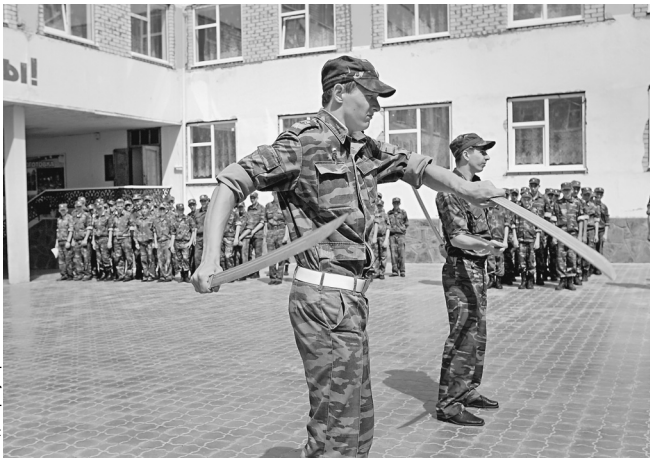
Возможно, отправляющиеся на «Селигер» пройдут спецподготовку

Как рассказали в пресс-службе, московские казаки будут оказывать «содействие организаторам и руководителям службы безопасности форума в поддержании общественного порядка». Также они планируют «участвовать в дебатах общественно-политической направленности» и проводить просветительскую работу — знакомить «всех желающих с историей российского казачества», пропагандировать свою «культуру и традиции, любовь к Отчизне и уважение к православию», рассказывать об «организации быта современных казаков». Как отметили в пресс-службе, представители московского казачества уже готовятся проводить на форуме уроки по рукопашному и ножевому боям.