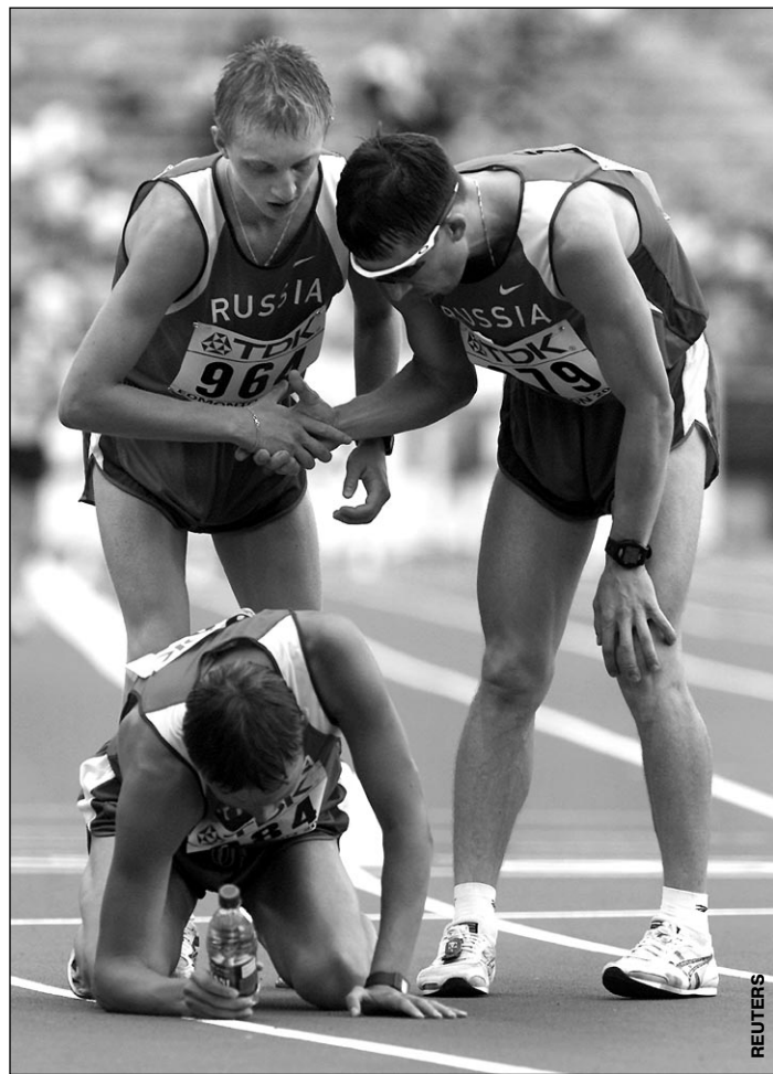
Суббота, Эдмонтон. «Русский» финиш в ходьбе на 20 км. Чемпион мира Роман РАССКАЗОВ (на коленях) и его товарищи по команде Илья МАРКОВ (справа) и Виктор БУРАЕВ, занявшие 2-е и 3-е места.

В субботу в Эдмонтоне сборная России добилась выдающегося успеха. Все места на пьедестале почести после ходьбы на 20 километров заняли российские спортсмены: золото у Романа Рассказова, серебро у Ильи Маркова, бронза у Виктора Бураева.