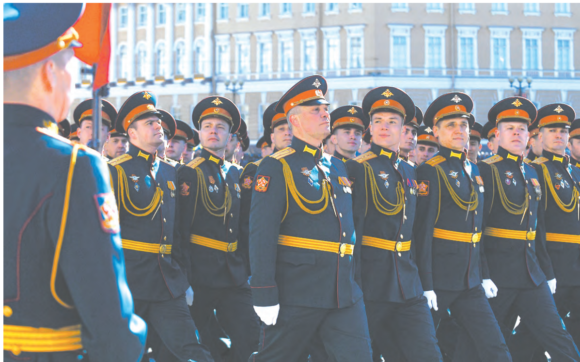
Чеканят шаг офицеры штаба Западного военного округа

Ещё больше военных новостей – по этому QR-коду