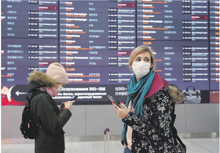
Павел Бондарев / Иллюстрация

Ural Airlines и Nordwind поддерживают инициативу, сообщили «Известиям» представители компаний. В пресс-службе «Аэрофлота» заявили, что предложение заслуживает внимания, но отметили: необходимо крайне осторожно относиться к вопросу проверки достоверности данных при их замене.