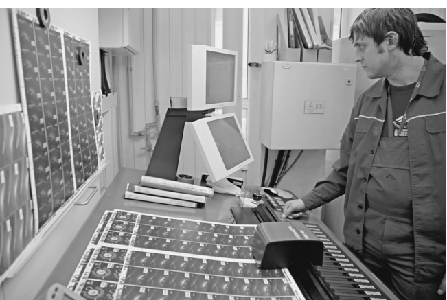
Изготовителей новых карт ждет солидный заказ