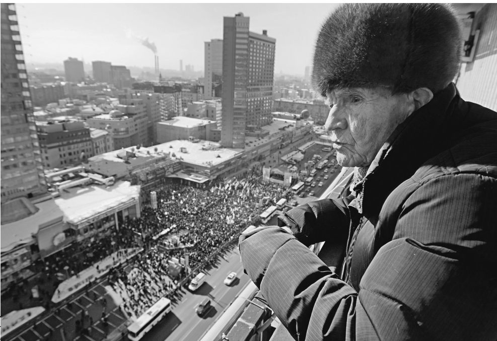
Старожилы Нового Арбата помнят мероприятия совсем другого масштаба