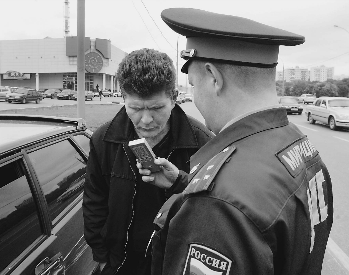
В скором времени никакие цифры, кроме нуля, инспектора ГИБДД не устроят

По предложению российского президента льготные 0,3 промилле собираются отменить