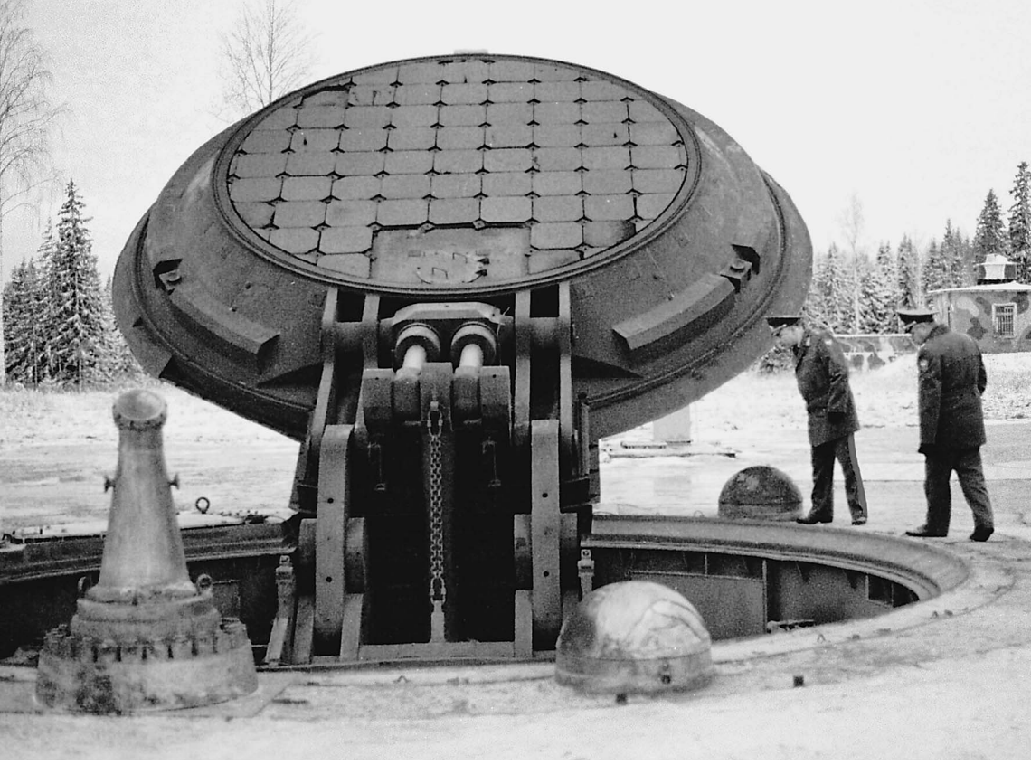
Договором предусматривается, что каждая из сторон имеет право самостоятельно определять состав и структуру своих стратегических наступательных вооружений

Угроза подтопления нависла над Россией. Паводок в этом году обещает быть настолько бурным, что к армии спасателей пришлось присоединиться даже премьер-министру Владимиру Путину. Путин уже отдал приказ бомбить льды на опережение. Их будут крушить также бензопилами, экскаваторами и ледоколами.