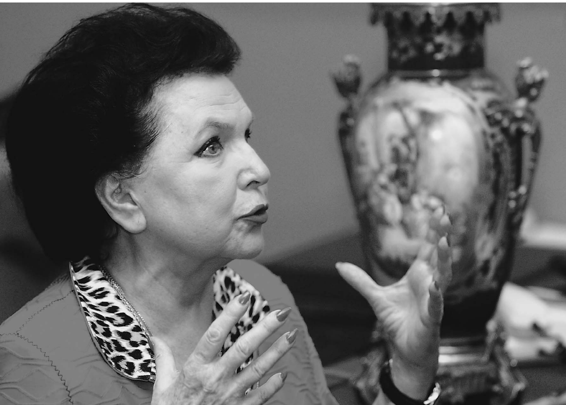
Галина Вишневская: «Медаль «За оборону Ленинграда» — моя самая великая награда»

ОФИЦИАЛЬНЫЕ (ЦЕНТРАЛЬНЫЙ БАНК РФ) КУРСЫ ВАЛЮТ К РУБЛЮ НА 27 МАРТА