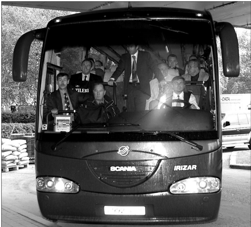
Вчера. Москва. Сборная Югославии прибывает в гостиницу «Международная».

Сборная отправится в Лужники сегодня в 16.30. Команда очень рассчитывает на поддержку болельщиков, о чем говорят и главный тренер Олег Романцев, и игроки. Улучшение погоды позволяет надеяться: несмотря на прямую трансляцию, трибуны лужниковского стадиона будут заполнены - впервые в нынешнем сезоне.