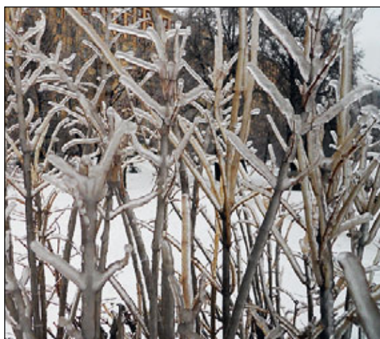
Москва, декабрь 2010 года. Вспоминая о ледяном дожде...