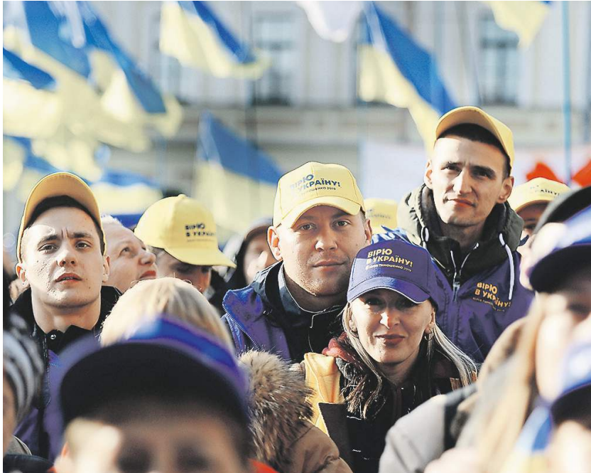
Большинство украинских избирателей проголосовали против действующей власти в первом туре президентских выборов | Тарас Петренко | «Известия»