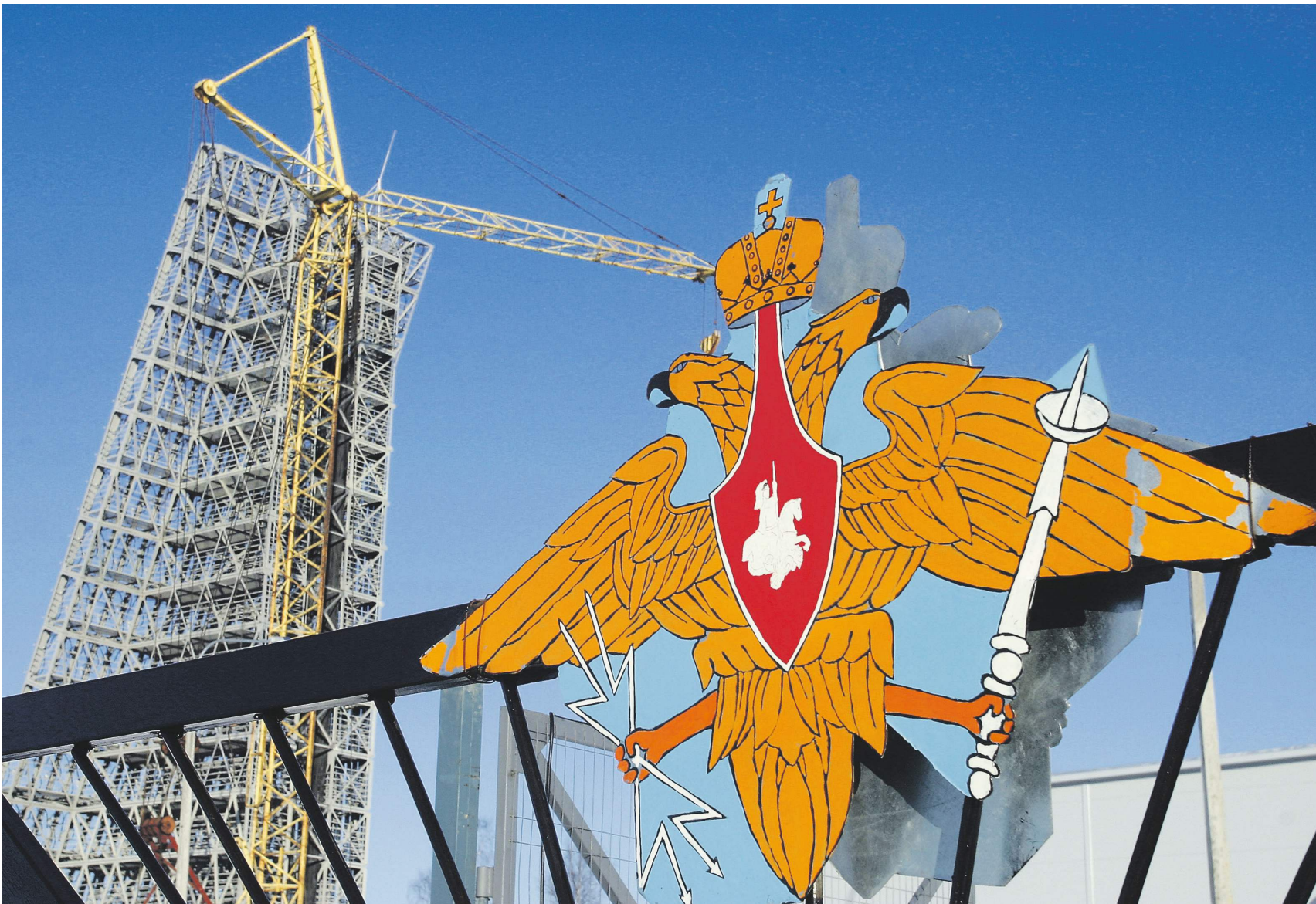
Радар «Воронеж» в Крыму будет построен по аналогу станции в Ленинградской области