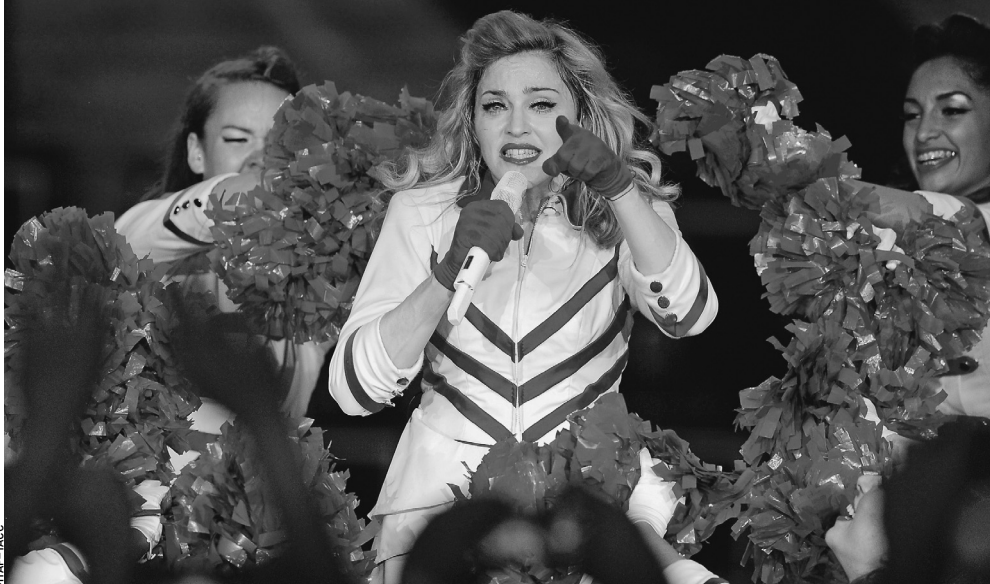
Петь и плясать в России звезда имела право, а вот получать за это деньги — нет