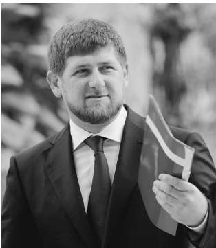
Рамзан Кадыров решил не спешить в Соединенные Штаты