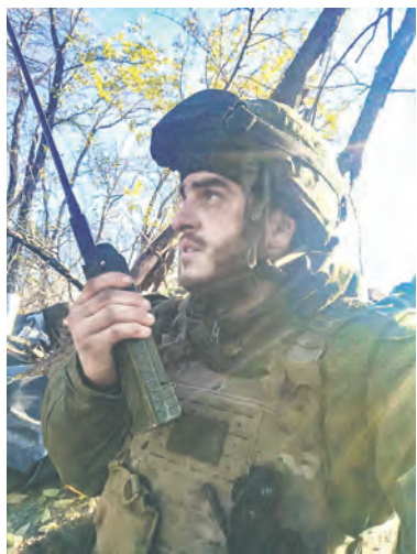
Командир батальона «Арцах».