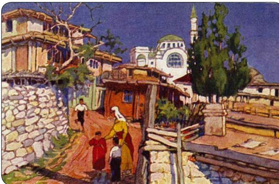
Гурзуф. Сакли и мечеть. Художник А. В. Мартынов