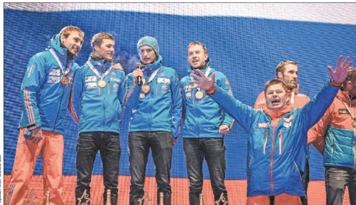
Суббота. Хохфильцен. Антон ШИПУЛИН, Антон БАБИКОВ, Максим ЦВЕТКОВ и Алексей ВОЛКОВ поют гимн России. Дмитрий ГУБЕРНИЕВ (справа) - дирижирует.