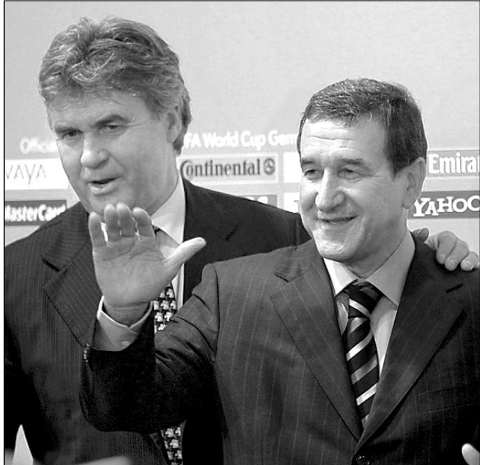
9 декабря 2005 года. Лейпциг. Гус ХИДДИНК и Карлос Алберту ПАРРЕЙРА после жеребьевки финального турнира ЧМ-2006, которая свела Австралию и Бразилию в группу F.