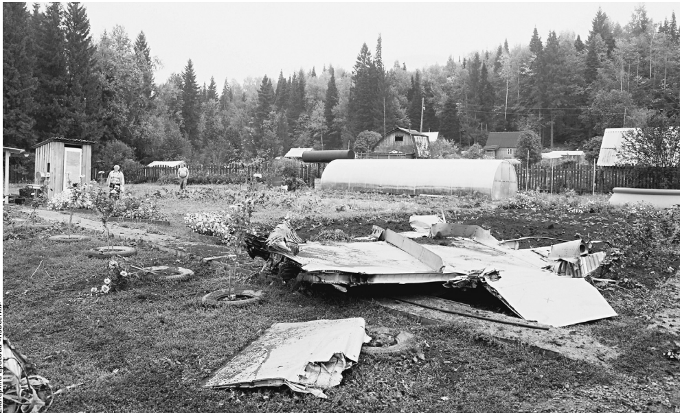
Погибли командир и штурман, на земле жертв нет. Трагедия произошла у деревни Болгары в Пермском крае. Причину катастрофы предстоит выяснить комиссии Минобороны и следователям