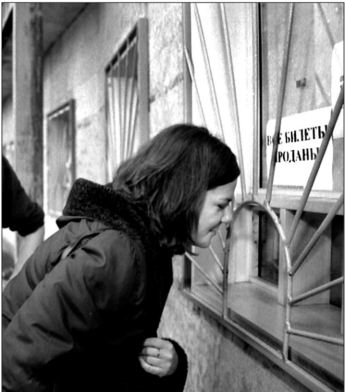
Вчера. Санкт-Петербург. Стадион «Петровский». За день до встречи двух претендентов на медали «Зенита» и «Локомотива» спрашивать билеты в кассах было бесполезно.

Юрий Морозов, смею предположить, подобным вопросом сейчас не задается. Главный тренер «Зенита» вообще не любит бегать вперед паровоза (прошу не усматривать здесь нарек на турнирные взаимоотношения «Зенита» и «Локомотива»), неохотно дает прогнозы и терпеть не может, когда кто-то предсказывает события. Спустя полчаса после победной игры в Саратове он на брошенную кем-то реплику: «Ну теперь то медали у нас в кармане!» - отреагировал немедленно, в привычном ему иронично-саркастиче-