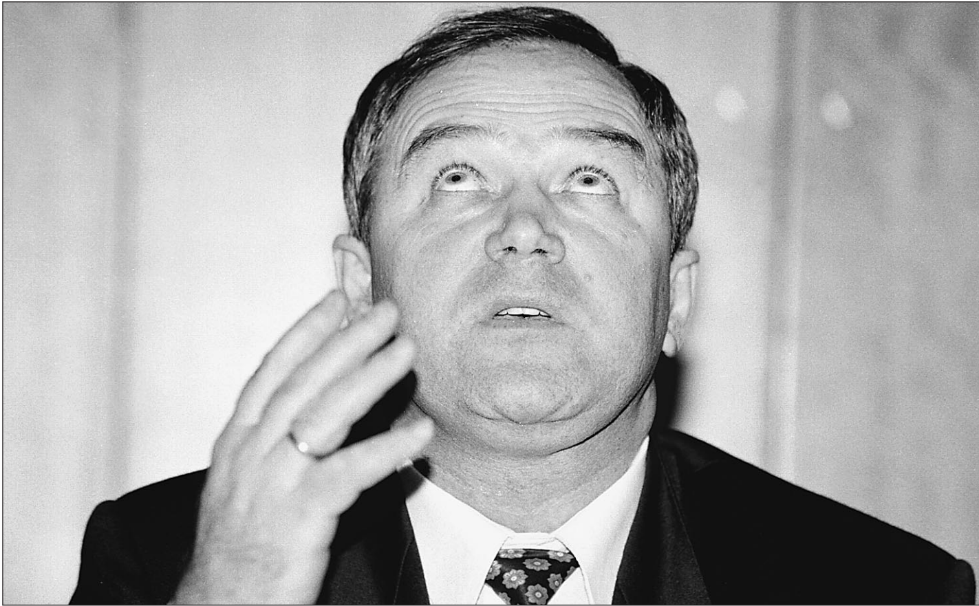
Евгений Наздратенко ищет справедливости на самом верку

ло...) Впрочем, все становится понятным, если заглянуть в первоисточник — распоряжение правительства от 13 февраля 2003 года № 186-р «О председателе Государственного комитета по рыболовству». «1. Отстранить Наздратенко Евгения Ивановича от исполнения обязанностей председателя Государственного комитета Российской Федерации по рыболовству». И точка. Про временно тут ни гугу. А уж публично оглашенный повод отставки по нынешним временам вовсе смехотворный: дескать, два властелина Приморья — прежний губернатор Наздратенко и нынешний Дарькин — вдрабада разругались из-за квот. Каждый старался, чтобы больше до-