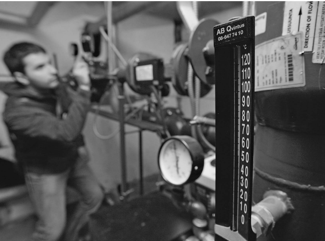
Индивидуальный тепловой пункт экспериментального дома в Жулебино

В Москве открылся отопительный сезон. Буквально накануне мэр Юрий Лужков пообещал снизить энергозатраты по ЖКХ в 2 раза, что поможет москвичам сэкономить на оплате электроэнергии, тепла и воды, — мол, ждать осталось недолго. В успехе начинания не сомневаются и в префектуре Юго-Восточного округа столицы. Говорят, на их территории есть «умный дом», в котором счетчики из каждой квартиры подключены к компьютеру, а за тепло люди платят не по усредненному тарифу, а только за потребленные гигакалории. В поисках обещанного коммунального рая «Известия» отправились в «спальный» район Жулебино. → стр. 3