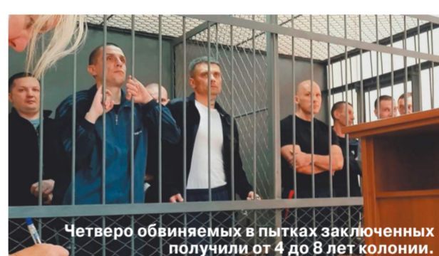
Четверо обвиняемых в пытках заключенных получили от 4 до 8 лет колонии.

На днях Куйбышевский районный суд Иркутска вынес приговор четверым осужденным, которые пытались и насиловали (им вменена 132 УК РФ «Насильственные действия сексуального характера») та же, как они, зэков. Фемиды назначила им довольно суровое наказание — от 4 до 8 лет лишения свободы.