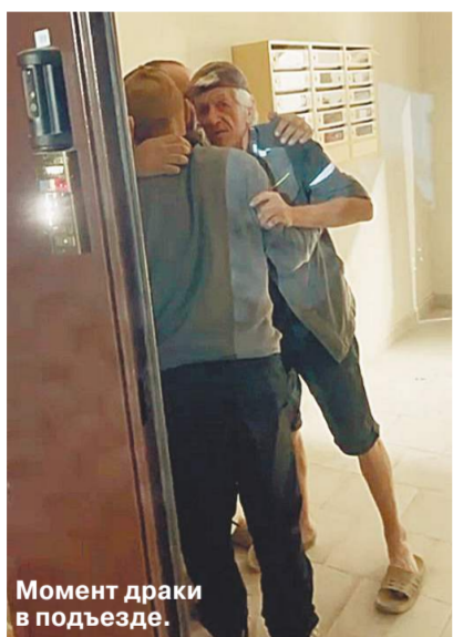
Момент драки в подъезде.

иницировать проверку, но в упреке им постоянно отказывали из-за нехватки доказательств. Собственно, поэтому супруга и бросилась снимать их на видео, чтобы в этот раз застройщик уже не смог отмахнуться, — поделился отец семейства.