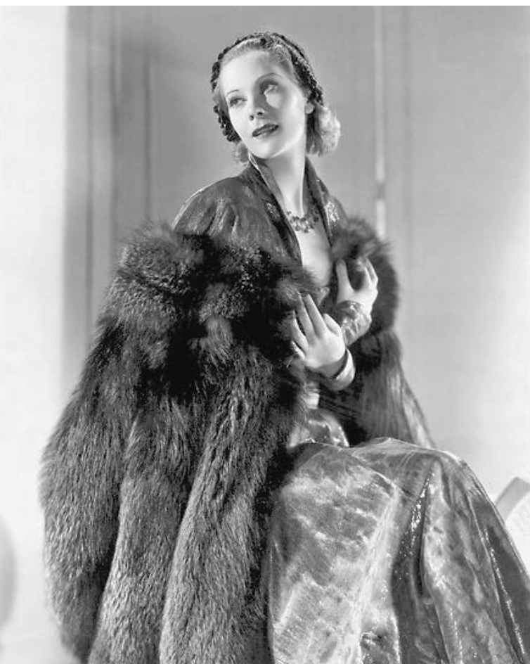
Наталья Палей из рода Романовых стала известной французской моделью и актрисой

Как жили, любили и умирали во Франции члены российской императорской фамилии