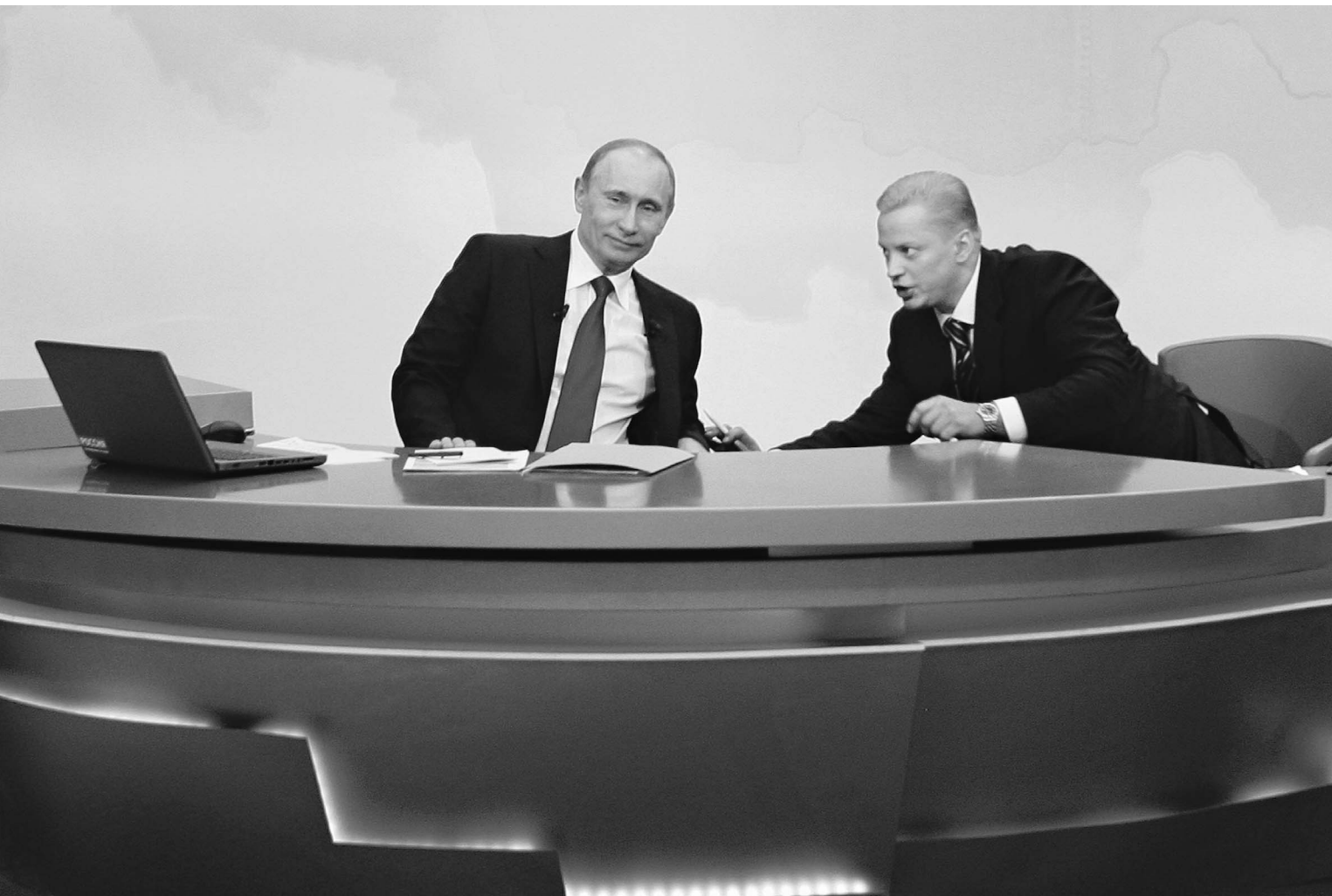
Ежегодное общение с гражданами в прямом эфире стало для Владимира Путина традицией

Владимир Путин начал отвечать на вопросы россиян в двенадцать дня по Москве и закончил в половине первого ночи по Камчатке