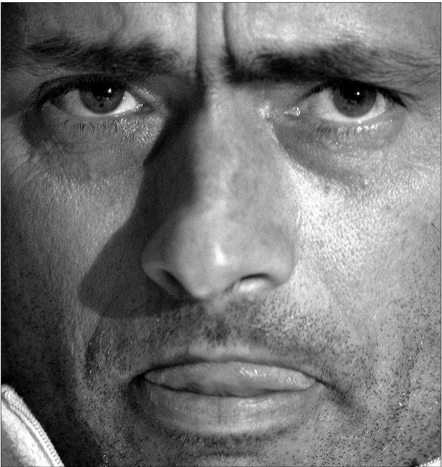
Вчера. Лондон. Жозе МОУРИНЬЮ.

Другие материалы о предстоящем матче - стр. 2 - 3