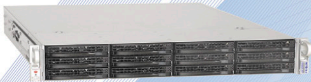
Сетевое хранилище ReadyNAS™ 4200 на 12 дисков