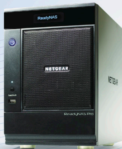
Сетевое хранилище ReadyNAS™ PRO на 6 дисков