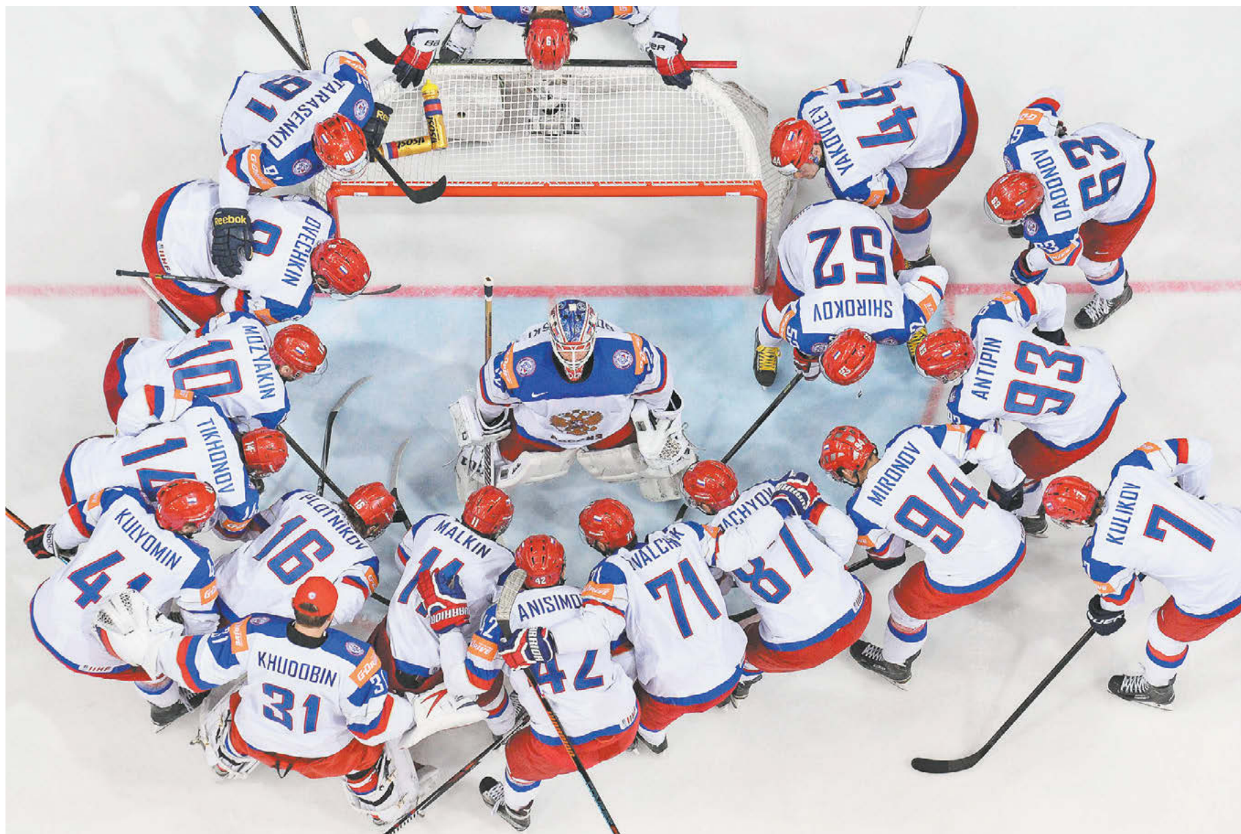
Из-за пандемии коронавируса мы не увидим энхаэловских звезд в составе сборной России до мая 2021 года

Президент Международной федерации хоккея (ИИХФ) дал большое интервью «СЭ» – о ситуации, сложившейся в мировом хоккее из-за эпидемии коронавируса, возможном переносе отмененного ЧМ в Швейцарии на год и переговорах с КХЛ по участию в ОИ-2022