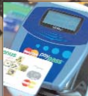
PayPass в России

Мошенничество и безопасность в индустрии платежных карточек Кризис и лидерство