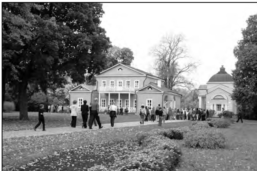
Родной дом М.Ю. Лермонтова

Именно такой подход может позволить, при несомненном нарастании соблазнов глобального информационного общества, доминирующем предпочтении им многоликого «масскульта», все-таки увидеть неистребленную и, хочется верить, неистребимую тягу к поэтическому слову, способному