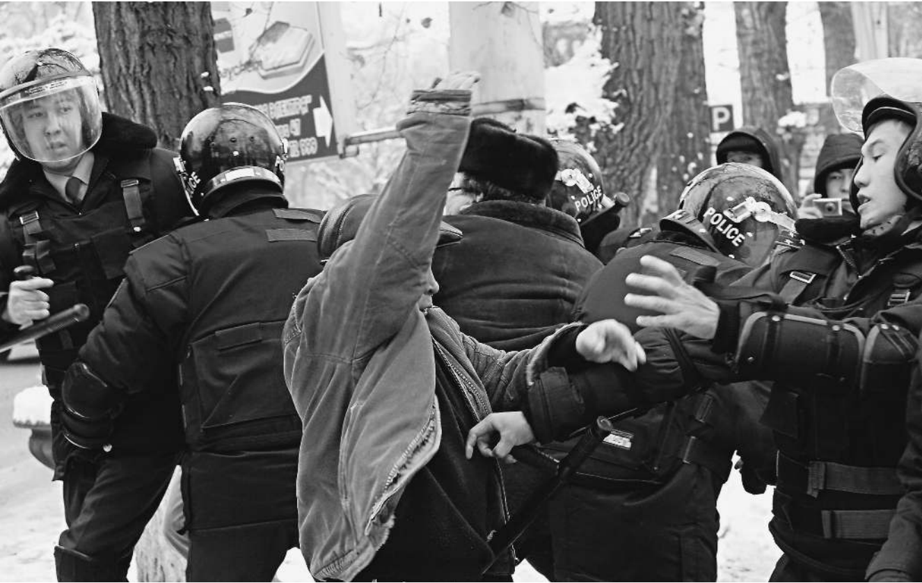
Не все протестующие вышли на улицы с голыми руками