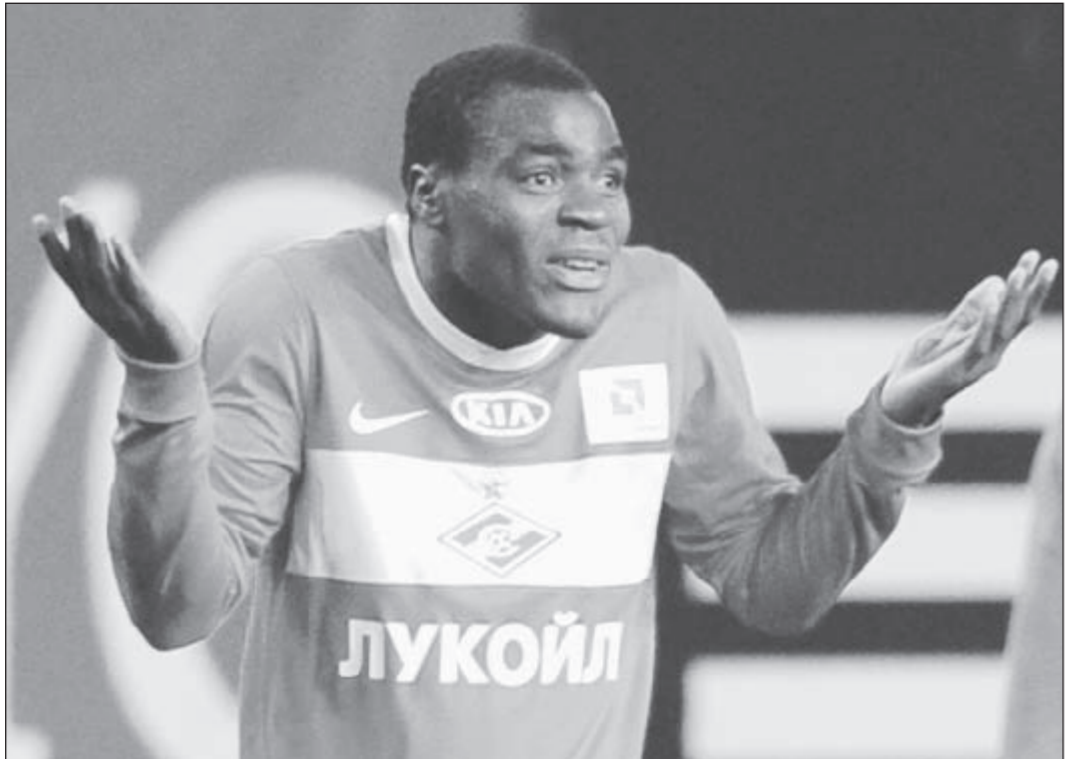
Эммануэл ЭМЕНИКЕ теперь знает: не всякий жест так безобиден, как этот.