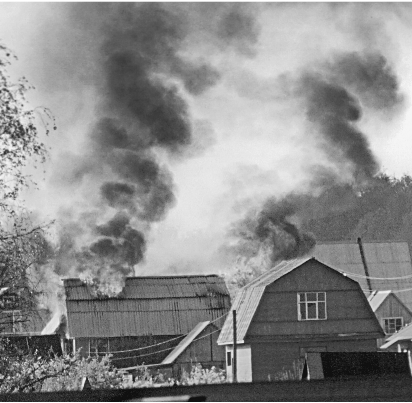
Погорельцам будет легче добиться от страховщиков честного погашения стоимости погибшего имущества