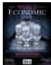
#7–8 (17–18) Illustration by Oleg Babkin