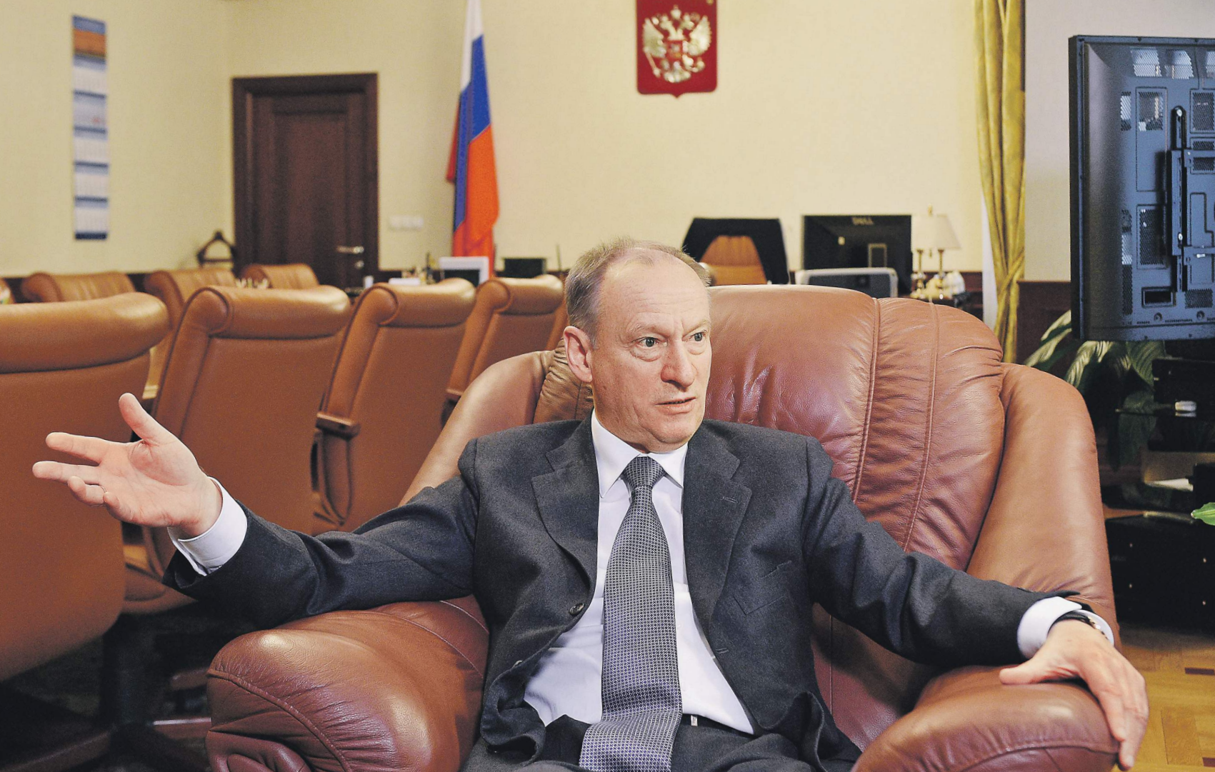
Патрушев Николай

Важно отметить, что органы правопорядка и спецслужбы работают слаженно по всем направлениям деятельности, повысилась эффективность борьбы с коррупцией, организован-